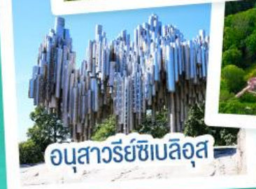
อนุสาวรีย์ซิบิลุส