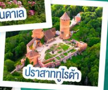
ปราสาทกูโรด้า