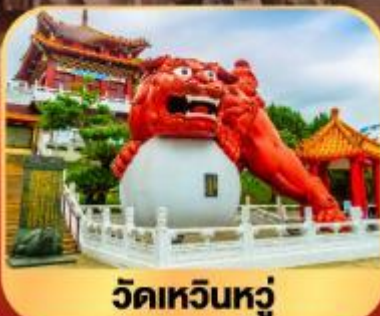
วัดเหวินหลู่