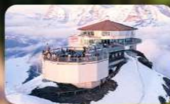
ทานอาหารที่ Piz Gloria กั้ตตาคารที่หมุนได้ 360 องศา