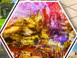
น้ำพุบิซิวส