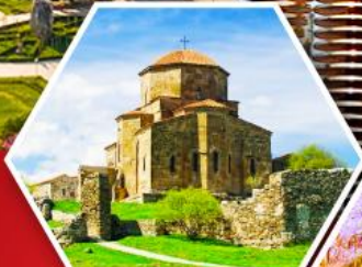
วิหารกอรี