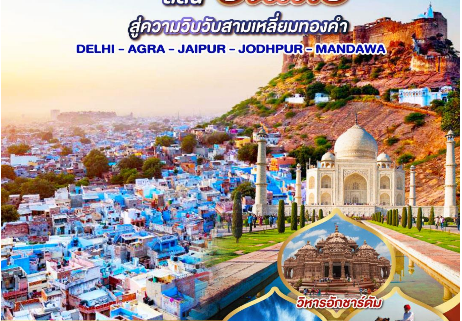
วิหารอักขารัติม

DELHI - AGRA - JAIPUR - JODHPUR - MANDAWA