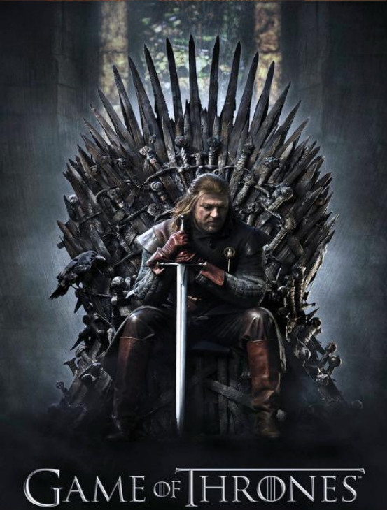
GAME OF THRONES