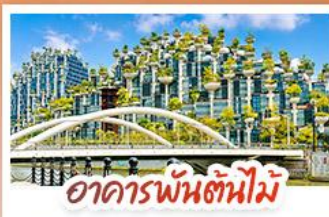
อาคารพันตันใหม่