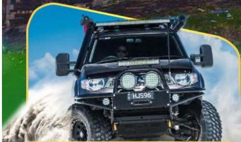
คันรถ 4WD สู้อีกกลางเทือกเขาคอเคซัส