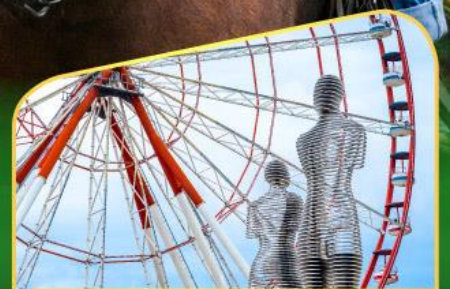
อนุสาวรีย์อาลีและนีโน่