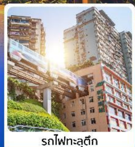
รถไฟฟ้าลูตึก