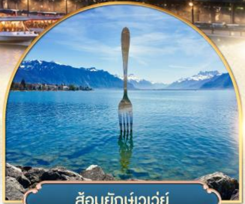
ส้อมยักษ์เวอว์ย