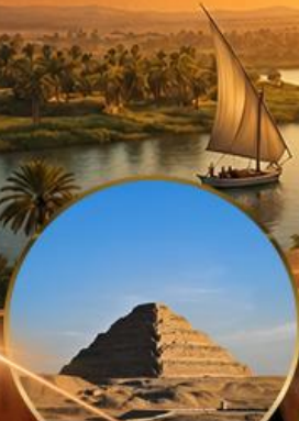
พีระมิดขั้นบันได

โคโร กัสซา เมมฟิส อเล็กซานเดรีย พิพิธภัณฑ์แกรนด์อียิปต์ GEM