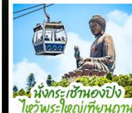
เน็กระเซ้าเองปิง ไซ่วพระใหญ่เทียนทาน