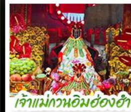
เจ้าแม่ทวนอิมฮ่องฮ่า