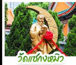
วัดเซ่งก้ง