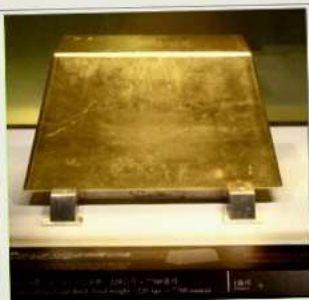
พิพิธภัณฑ์ทองคำ