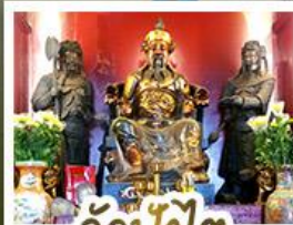
ว้ดป้กโก๊ต