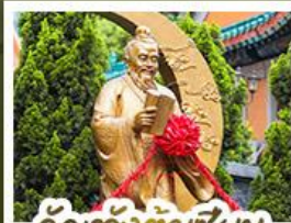
ว้ดเว้งต้าเซ็งน