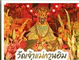
ว้ดเจ้แม่กวนอิมอ่องฮ่า