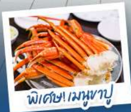
พิซซ่าเมงูฮายู