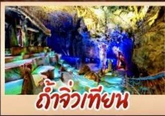
ถ้ำจิวเทียน