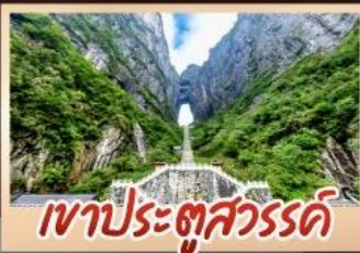
เขาประตูลสวรรค์