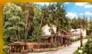
Oi-Qaragai Mountain Resort