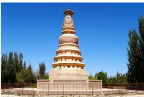
เจดีย์ม้าขาว

เที่ยง รับประทานอาหารกลางวัน ณ ภัตตาคาร (10)