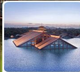
พิพิธภัณฑ์ไต้หน้ำกวงฟู่หลิน