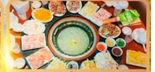
สุกี้เด็ด