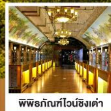
พิพิธภัณฑ์ไวน์ชิงเต่า