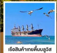
เรือสินค้าเกย์ตันบลูวิส