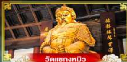
วัดเขangkทิว