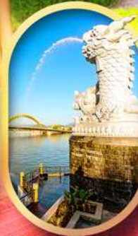
คาร์พดราทอน