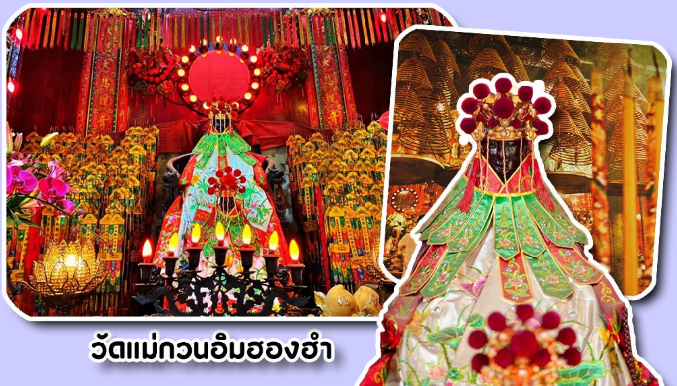
วัดแม่กวณิมสองฮ่า

จากนั้นพาท่านเข้าไปไหว้ขอพร วัดแม่กวณิมสองฮ่า วัดเก่าแก่ของฮ่องกงสร้างตั้งแต่ปี ค.ศ .1873 เป็นวัดขนาดเล็กที่มีชาวฮ่องกงศรัทธานับถือกันเป็นอย่างมากวัดแห่งนี้เป็นที่ประดิษฐาน องค์เจ้าแม่กวณิมสองฮ่า ที่มีชื่อเสียงเรื่องการให้กู้ยืมเงินเชื่อกันว่าท่านช่วยพลิกฟื้นเศรษฐกิจของชาวฮ่องกง ผู้คนจึงนิยมมาเยี่ยมเงินทำธุรกิจจนสำเร็จ ร่ำรวย รุ่งเรืองโดยให้ท่านอธิษฐานขอพรต่อหน้า เจ้าแม่กวณิมสองฮ่าพร้อมกับระบุวันเวลาในการขอพรด้วย จากนั้นนำธูปธูปตามฐานะและศรัทธาที่เราจะนำเป็นสื่อในการขอพร เขียนจำนวนเงินที่ต้องการลงไปด้วย ใส่สกุลเงินยี่งดีใหญ่ แล้วนำเงินใส่ในซองแดง ควรเตรียมซองแดงไปเอง นำซองแดงไปวนรอบกระถางธูป วนขวาจำนวน 3 ครั้ง แล้วเก็บซองแดงในกระเป๋าสตางค์ เป็นเงินขวัญถุง ถ้าประสบความสำเร็จตามที่มุ่งหวัง ให้นำเงินในซองแดงทำบุญหยอดตู้ที่วัดแห่งนี้ในโอกาสต่อไป