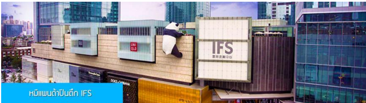
หมีแพนด้าปีนตึก IFS

เที่ยง รับประทานอาหารกลางวัน ณ ภัตตาคาร (14)