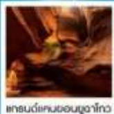
แกรนด์แคนยอนยูลาโกว