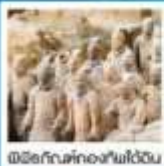
เมืองโบราณที่หลงใหลได้ฉ่ำ