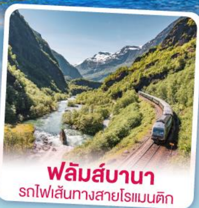
ฟลัมส์บานา รถไฟเส้นทางสายโรเมนติก