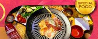
พิเศษเมนู BBQ Buffet เดินทาง มี.ค. - ต.ค. 69