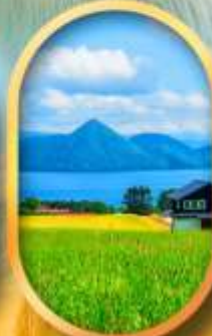
ทะเลสาบโทโยะ