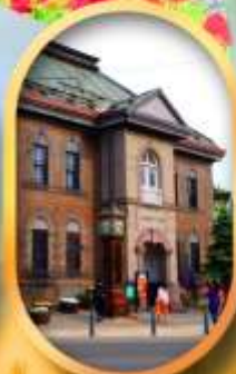
พิพิธภัณฑ์กล่องดนตรี