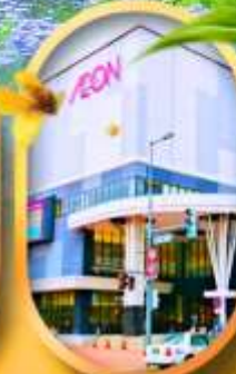
อออนมอลล์