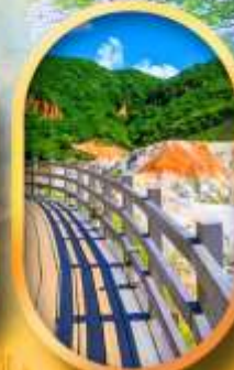
โนโบริเบทสึ