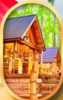
บึงเทิลเกอเฮส