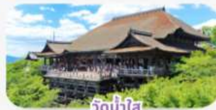
วัดน้ำใส