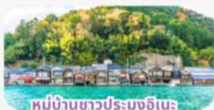
หมู่บ้านชาวประมงอิเนะ