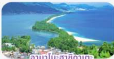
อามาโนะฮาซิดาเตะ