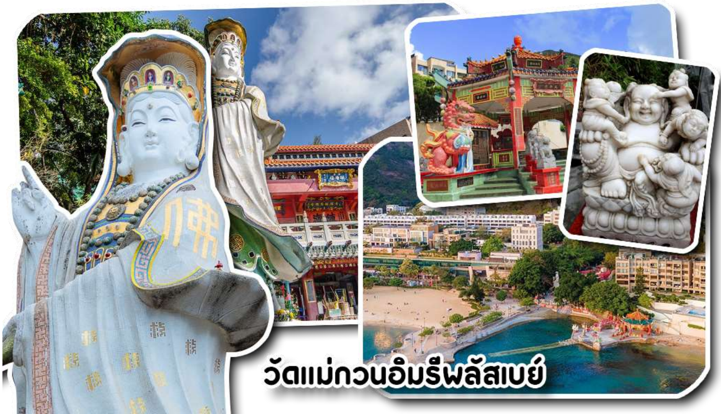
วัดแม่กวอนอิมริพลัสเบย์

จากนั้นพาท่านเดินทางไปนมัสการ เจ้าแม่กวอนอิมริมหาดริพลัสเบย์ วัดแห่งนี้ถูกสร้างขึ้นเพื่อ คุ้มครองชาวประมงเวลาออกเรือไปหาปลาในสมัยก่อน บริเวณวัดมีสิ่งศักดิ์สิทธิ์มากมาย ได้แก่ เจ้าแม่กวอนอิม ประดิษฐานอยู่ทางด้านซ้ายของวัด ซึ่งผู้คนนิยมเดินทางไปกราบไหว้ขอพรเรื่องกรรมนิบุตร และยังมีพระสังกัจจายที่ เชื่อกันว่าสามารถขอเพศของบุตรที่จะมาเกิดได้ โดยหลังจากกราบไหว้แล้วก็ให้ลูกที่ท้องของพระสังกัจจาย ถ้าอยาก ได้ลูกชายให้ลูบท้องซ้าย อยากได้ลูกสาวให้ลูบท้องขวา ถัดมาคือ เจ้าแม่ทับทิมเทพีแห่งท้องทะเล ท่านจะคอย คุ้มครองผู้เดินทางทางเรือ หรือผู้ที่เดินทางไปไหนมาไหนท่านจะคอยคุ้มครองให้ปลอดภัย และมีโชคลาภ ถัดจาก บริเวณที่กราบไหว้ขอพร ก็จะมีศาลาแปดเหลี่ยมริมน้ำ และสะพานเล็กๆ ที่ชื่อว่าสะพานต่ออายุ ซึ่งเชื่อกันว่าหากเดิน ข้ามสะพานแห่งนี้ 1 ครั้ง ก็จะมีอายุยืนขึ้น 3 ปี