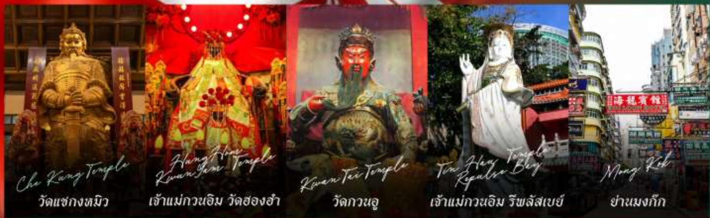
Che Kung Temple วัดแชกงงทมิว

รายการทัวร์ข้างต้นอาจมีการปรับเปลี่ยนเพื่อความเหมาะสม