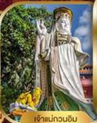
เจ้าแม่กวนอิม ริฟลิสซีย์