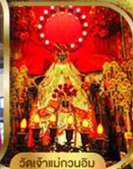
วัดเจ้าแม่กวนอิม สองอ่า