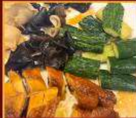
ไก่ แดงกวาง เห็ดหูหนู