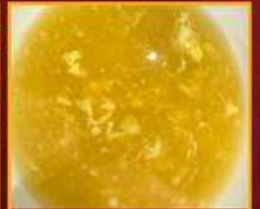
ซุปรข้าวโพด