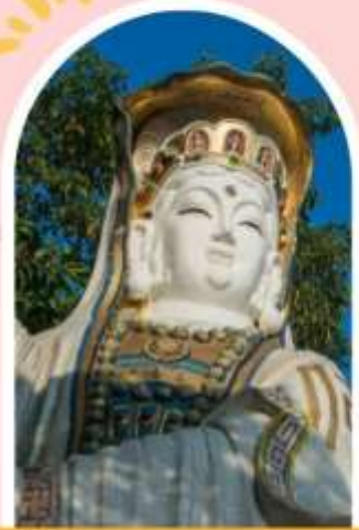
ริพลัสเบย์