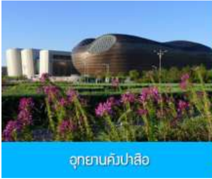
อุทยานคังปาสื่อ