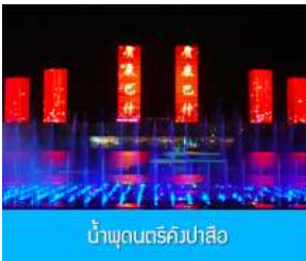
น้ำพุดนตรีคังปาสื่อ