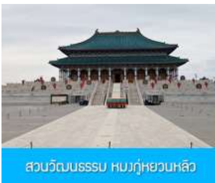
สวนวัฒนธรรมสสม หมงกู่หยวนหลิว

หลังอาหารนำท่าน เที่ยวชม จวนอ๋องจวินหวัง 郡王府 จวนแห่งนี้เริ่มสร้างขึ้นในปี ค.ศ. 1902 สร้างเสร็จในปี ค.ศ. 1936 เป็นที่พำนักของ อ๋องอินจวินหวัง 伊旗郡王 เป็นจวนอ๋องเพียงหนึ่งเดียวได้รับการอนุรักษ์ในสภาพที่สมบูรณ์ โครงสร้างทำด้วยอิฐ หิน และ ไม้ ประกอบด้วยห้องพัก 16 ห้อง เป็นสถาปัตยกรรมผสมแบบมองโกล ทิเบต และฮั่น