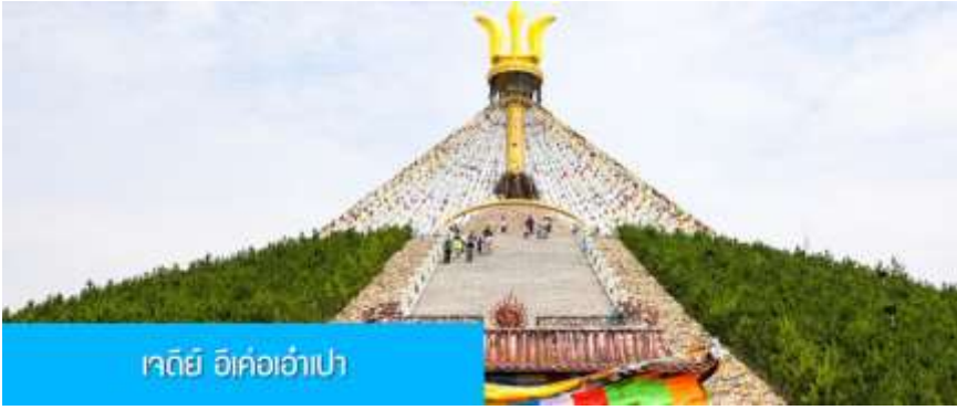
เจดีย์ อี้เค่อเอาเปา