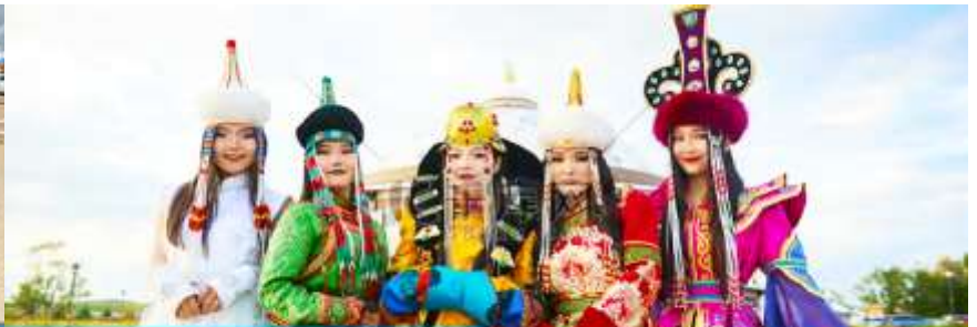
แต่งชุดพื้นเมืองมองโกล