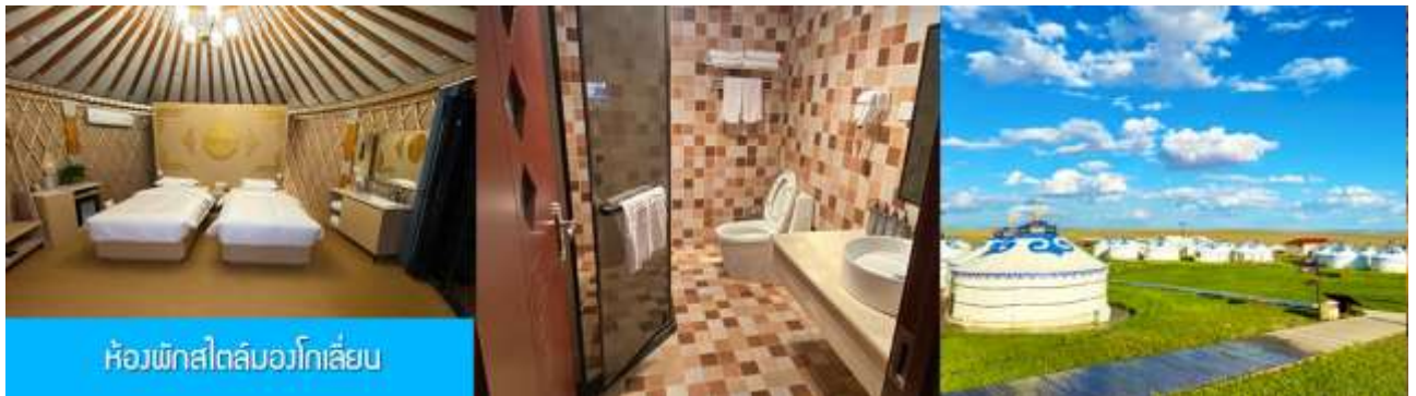
ห้องพักสไตล์มอโกลเลียน