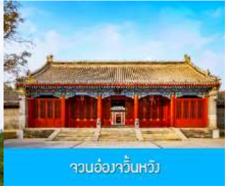
จวนอ๋องจวินหวัง

วันที่หก เมืองเออร์ดอส –อี้เค่อเอาเปา–พิพิธภัณฑ์เครื่องเงิน-จวนอ๋องจวินหวัง- สวนวัฒนธรรมหมงกู่หยวน หลิว-ซ้อปี่งถนคนเดิน