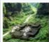
หุบเขาไฟสพานสวรรค์