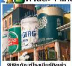
พิพิธภัณฑ์โรงเบียร์ชิงเต่า