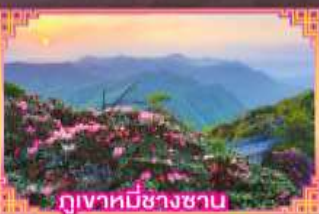
ภูเขาหมีขาซาน