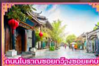
ถนนโบราณซอยกว้างซอยแคบ