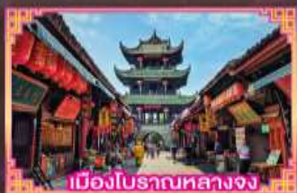
เมืองโบราณหลวงจง