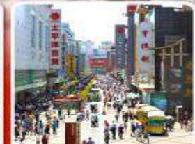
ช้อปปิ้งถนนคนเดินชุนซีลู่