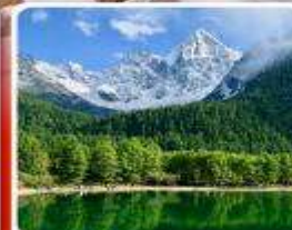
อุทยานπίงโถว