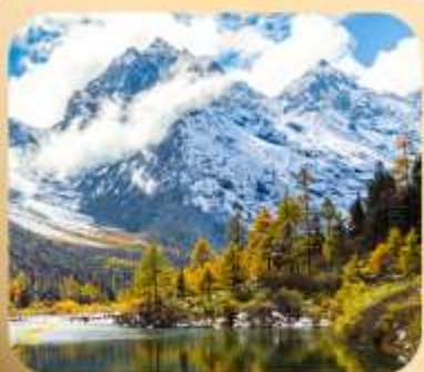
“ปี่เฟิงโกว”

ชมธรรมชาติ 2 อุทยานขึ้นชื่อ อุทยานภูเขาสี่ดรุณี + อุทยานปี่เฟิงโกว สะพานหนานเฉียว • ถนนคนเดินไก่อู๋หลี่ + ชุนซีลู่ + Pop Mart • ดงเจียวจื่อ