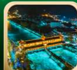
“สะพานหนานเฉียว น้ำตาสีฟ้า”