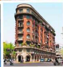
ถนนอุคัง