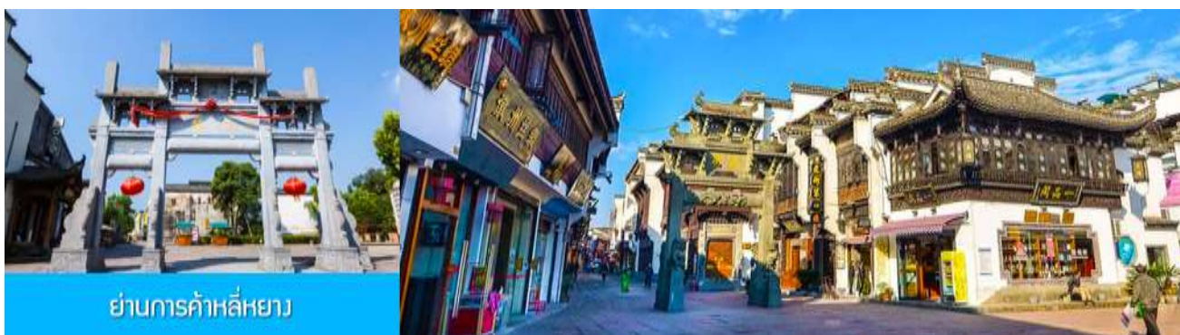
ย่านการค้าลี่หยาง

เที่ยง อิสระอาหารมื้อกลางวัน ( ท่านสามารถเลือกชิมอาหารพื้นเมืองในระแวกโรงแรมได้ตามอัธยาศัย )