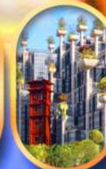
อาคาร 1,000 คัดไม้