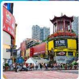
ถนนหวงซิงลู่