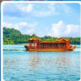
ล่องเรือทะเลสาบหลิวยวู่หู