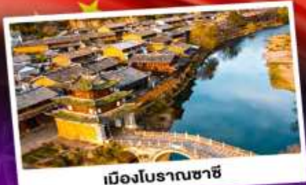
เมืองโบราณซาซี

ชมดอกไม้บานสะพรั่งทั่วยูนนาน "เซ็ดอี่แฉาเพ่ว่วาสุดอี่ง"