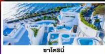
ซาโตรนี่