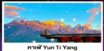
คาเฟ่ Yun Ti Yang