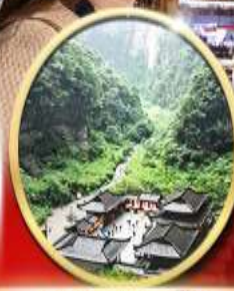
อุทยานหลุมฟ้า สะพาน สวรรค์