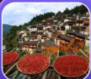
"หมู่บ้านทองหลิง"

หุบเขาเทวดาฉงเซี่ยนกู่ หมู่บ้านที่ตั้งอยู่ริมหน้าผา • หมู่บ้านโบราณทองหลิง ป่าสนน้ำชิงซาน • ล่องเรือทะเลสาบซีหู • ถนนโบราณตุ๋นจ้อ • ชมแสงสีที่ อุ๋นนี่โจว