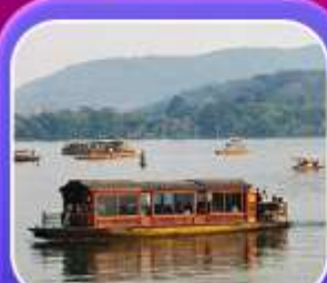
"ล่องเรือทะเลสาบซีหู"