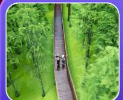
"ป่าสนชิงซาน"