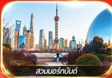
สวนนอร์มันด์