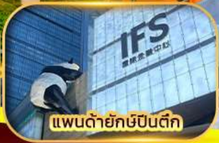
แพนด้ายักษ์ปิ่นตึก