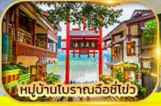
หมู่บ้านโบราณฉือซีไป๋